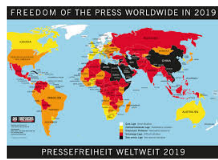
Freedom of Press – Prsessefreiheit weltweit