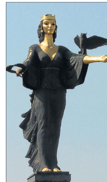
Wo einst Lenin für weniger glorreiche Zeiten stand, thront heute die Statue der Sofia im Stadtzentrum.

Bescheiden dagegen nimmt sich die 1979 in die Welterbeliste der Unesco aufgenommene Kirche von Boyana an. Der Weg in den gleichnamigen Stadtteil lohnt dennoch allemal: Wertvolle, mehrschichtige Malereien aus verschiedenen Zeitaltern der Landesgeschichte - Bildnisse von Jesus Christus und der Muttergottes, von bulgarischen