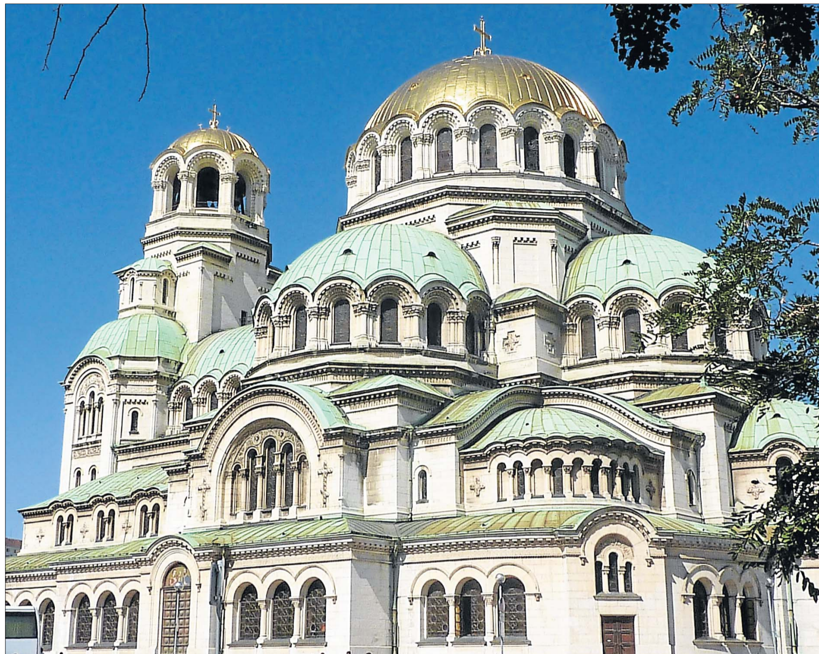
Stadt der Kirchen: Die imposante neobyzantinische Alexander-Newski-Kathedrale erinnert an Zar Alexander II. und bietet 5 000 Gläubigen Platz.

Und so lädt die bulgarische Metropole heute zu einer Reise durch sehenswerte und weniger glückliche Architektur ein, an denen zwar einerseits der Zahn der Zeit weiter nagt, andererseits aber die Moderne unentwegt fortschreitet