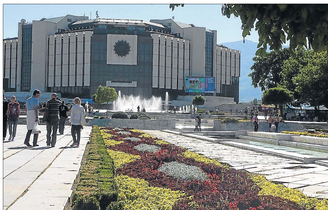
Die Umgebung des protzigen Kulturpalastes lädt zum Flanieren abseits der Hektik der Großstadt ein.