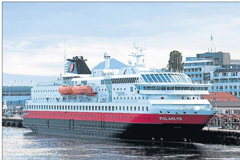
Die MS Polarlys kann maximal 619 Passagiere aufnehmen.

Die legendäre Postschiffroute an Bord der MS Polarlys